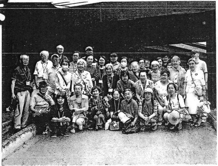
7/18 金山・舟形若あゆ温泉へ