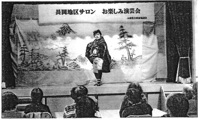
11/21 とんと昔語りと股旅の方の踊り