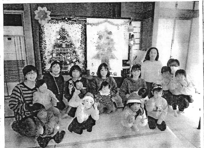
12/21 楽しいクリスマス会