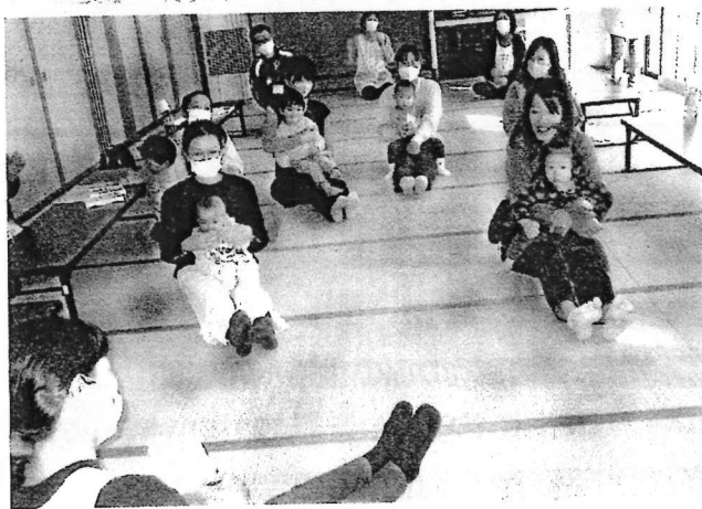
11/22 ママのお膝でバスごっこ (ながおか保育園子育て支援センター出前保育)