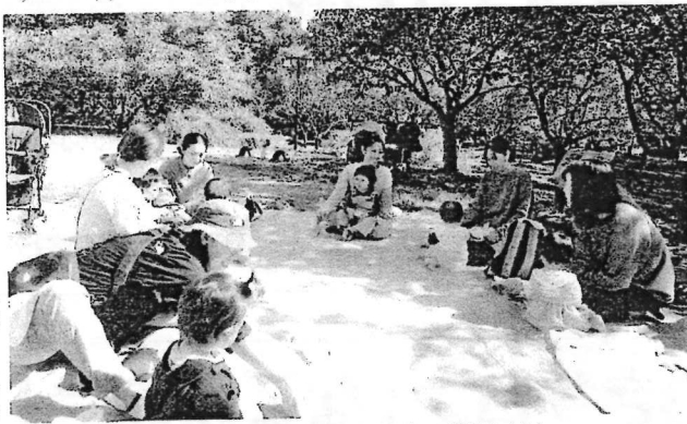
10/22 運動公園でのびのび遊んだよ