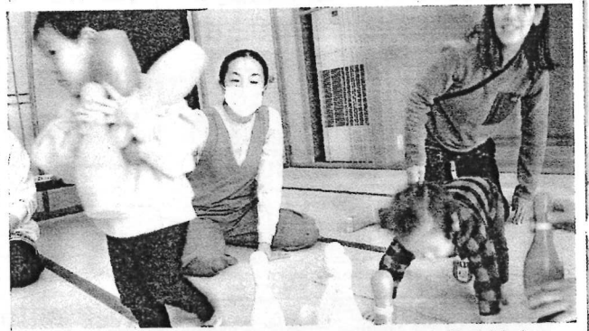
11/22 全員輪になり中でボールをころころ遊びました