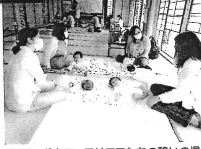
5/25 りんごっこはママたちの憩いの場