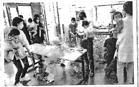
6/22 みんなで七夕飾りを作成し公民館のロビーに飾ったよ