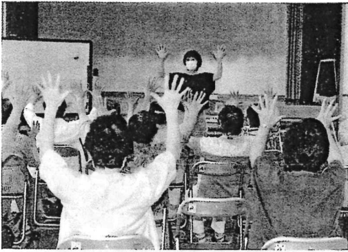
8/25 音楽を使つての健康づくり