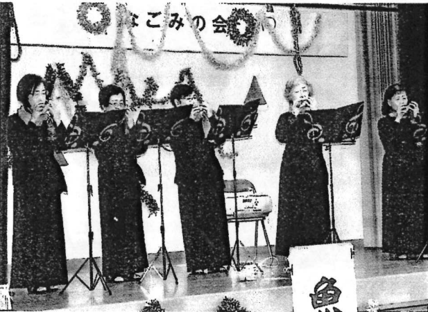
オカリーナサークル演奏