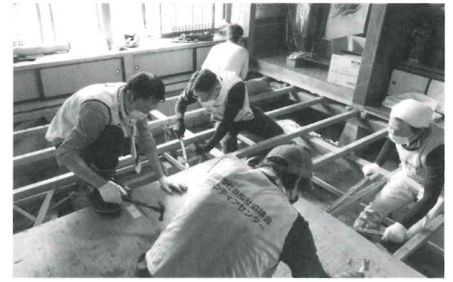
災害ボランティア (豪雨で被災した飯豊町への支援)