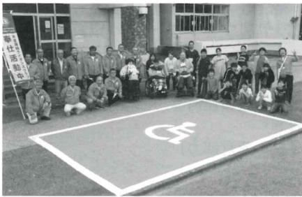
福祉教育事業 (障がい者駐車場の青色塗装)