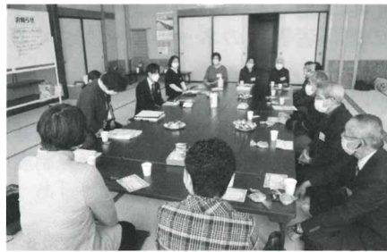
住民助け合い活動茶話会 「天童びすけっと（微助っ人）会」