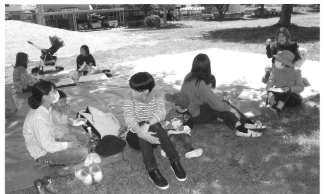
5/11 お外は気持ちいいね