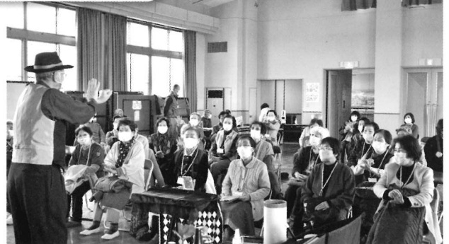
2/24 みとちゃんのマジックショー