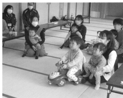
3/23 おしゃべりサロン