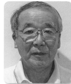
中里第三町内会 会長 (中里第三)