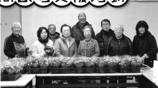
2/3 一人暮らし高齢者激励花訪問