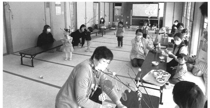
1/27 だんご木飾りできたね!