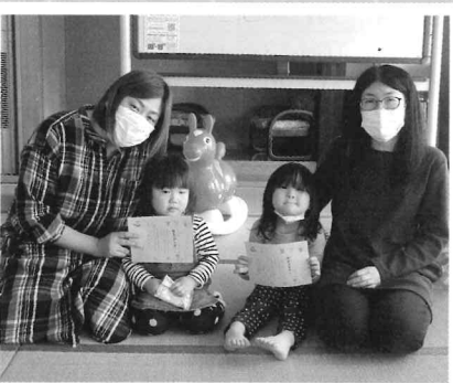
3/24 修了式 幼稚園でも元気だね