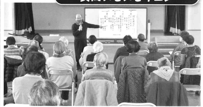
2/18 懐かしい歌を皆で歌いましょう