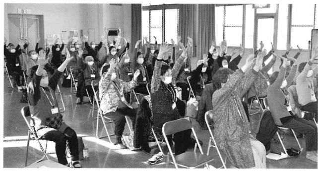
2/18 音楽に合わせて楽しい体操