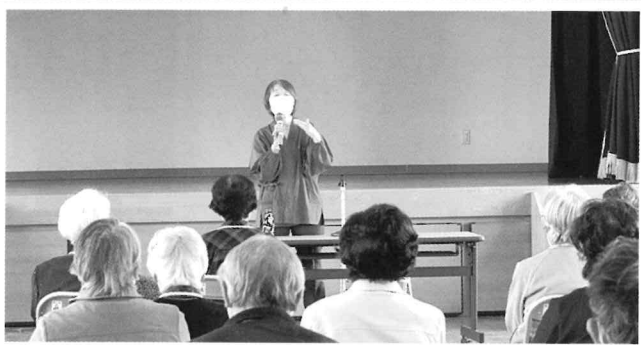
4/19 天童のとなと昔を聞いてみませんか