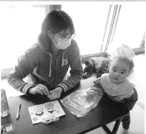
2/24 ママとお雛飾り作り