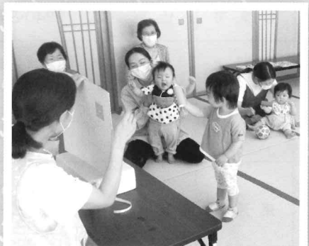
5/26 みんな大きくなーれ!