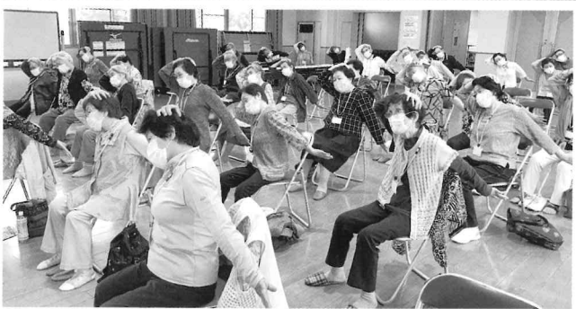
5/27 長い呼吸と手足を伸ばして楽しく体操