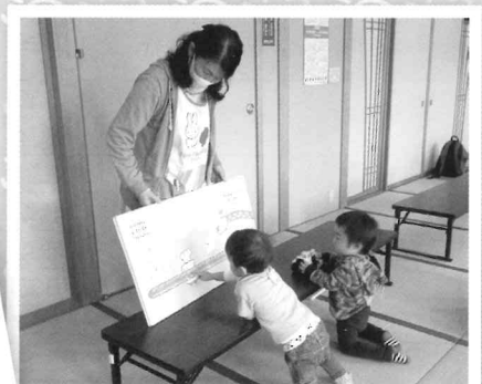
4/14 大きな絵本楽しいな