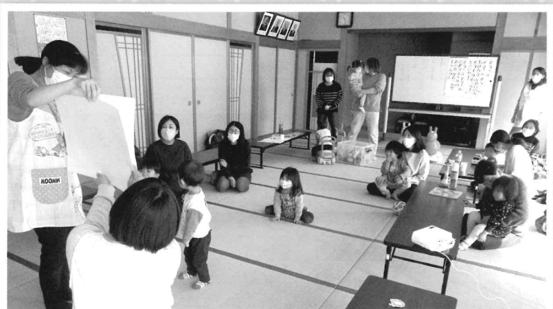
3/10 ながおか保育園の先生とあそんだよ