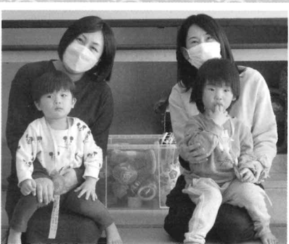
3/10 お誕生日おめでとう!