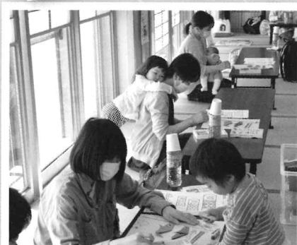
4/28 こいのぼりできたよ