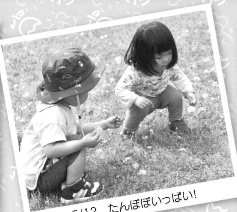
5/12 たんぽぽいっぱい!