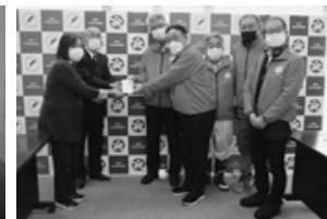
天童舞鶴ライオンズクラブ 様