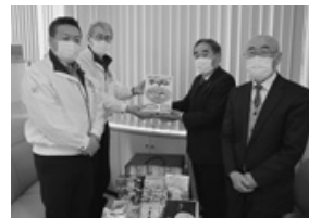
天童中央ライオンズクラブ 様