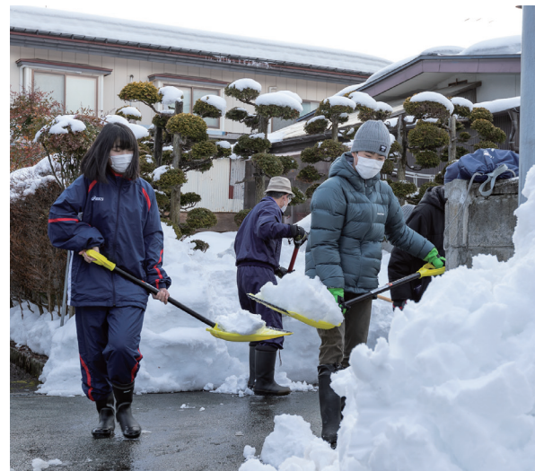
熱心にスコップで除雪する天童北部小の児童

児童たちは対象世帯を訪れると、家や周辺道路にたまった雪をスコップやスノーダンプで手際よく除雪し、歩きやすい路面にしました。作業を見守った方は「雪がいっぱい困っていた。本当に助かりました」と笑顔。この事業は天童北部地域社協や地区の民生児童委員、町内会などの協力のもと、同校の総合学習の一環として実施され、1月から2月の期間に合計15世帯の除雪を行いました。