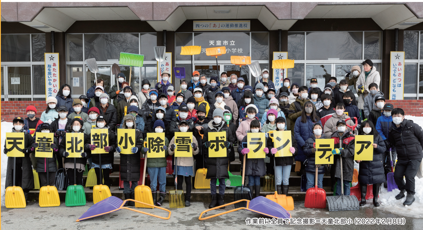
作業前に全員で記念撮影=天童北部小(2022年2月8日)