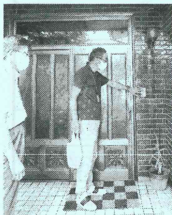
<訪問する福祉推進員>