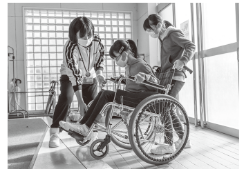
福祉教育事業 (小学校での車いす体験学習)