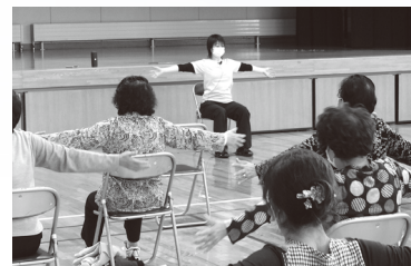
さわやか健康教室