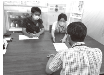
各種相談支援事業