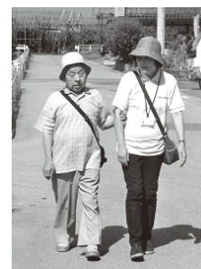
訪問介護サービス事業 (同行援護)