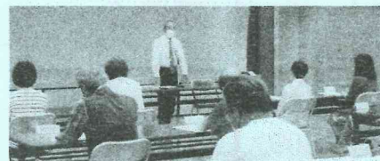
&lt;福祉推進員全体会&gt;

今回、高掬地域社協だより第15号をお届けしますが、本来、この紙面には半年間の活動の様子を掲載する予定でした。しかし、3月以降、新型コロナウイルスの関係で全ての活動を停止せざるを得